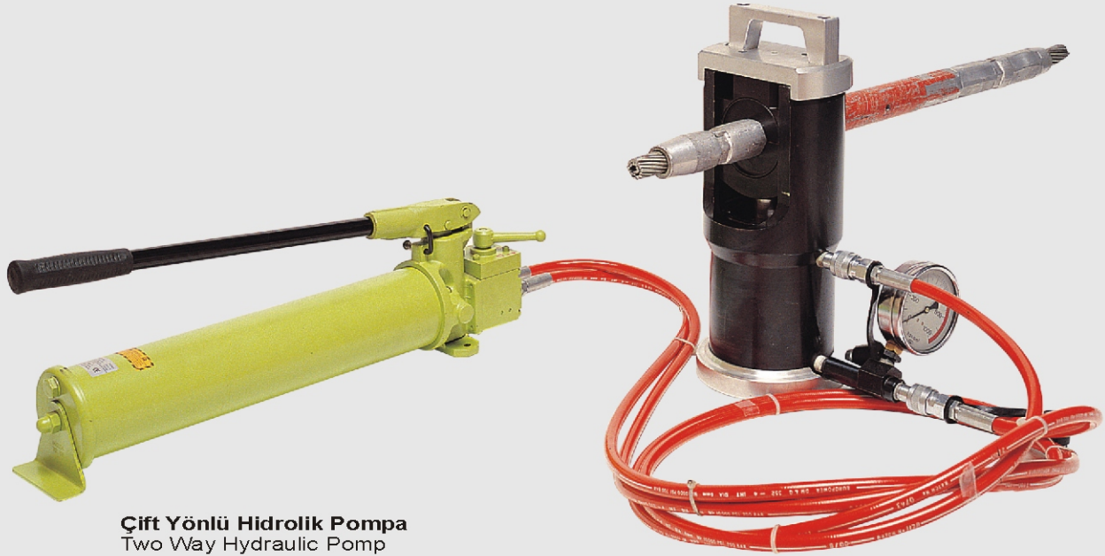
Çift Yönlü Hidrolik Pompa Two Way Hydraulic Pump